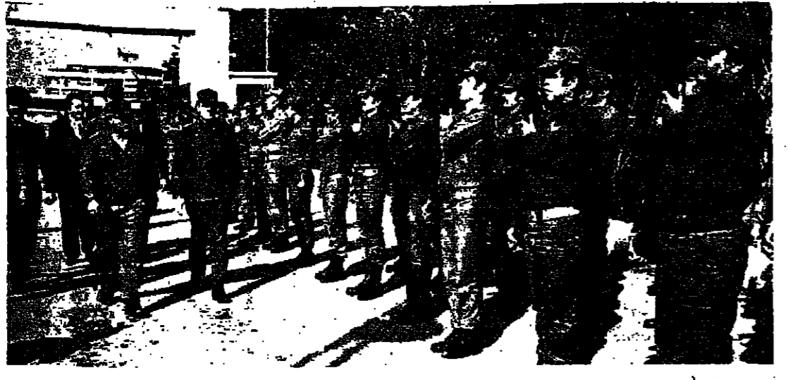
قائد الجيش يستعرض الجنود